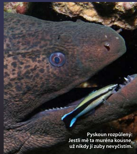
Pyskoun rozpúlený: Jestli mě ta muréna koušne, už nikdy jí zuby nevyčistím.

Čistíči používají rozličné signály, jak přivábit zákazníka. I zde vládne tvrdý kon-