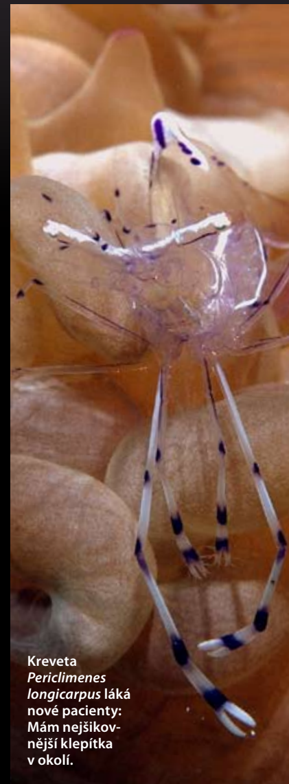
Kreveta Periclimenes longicarpus láká nové pacienty: Mám nejšikovnější klepítka v okolí.