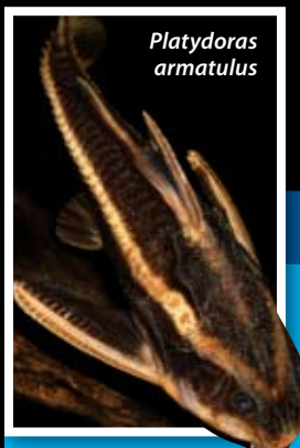
Sladkovodní sumeček Platydoras

Celý proces má odborný název čistící symbióza. Jedná se o unikátní vztah mezi mořskými organismy, ve kterém takzvaný čistíč odstraňuje vnější parazity, bakterie, nemocnou nebo poraněnou kůži, nečistoty a hlavně zbytky potravy z ryb a dalších živočichů. Výhody mají obě strany. Ryba je očištěna od nežádoucích zbytků a parazitů a čistíč má díky tomu snadno získanou potravu. Díky svým službám jsou čistíči v relativním bezpečí před predátory, protože právě ti jsou velmi častou a váženou klientelou. Rozmístění čistících stanic dokonce ovlivňuje i rozšíření korálových ryb na útesu. Pokud není dostupná dostatečná zdravotní péče, ryby se zkrátka přestěhují jinam.