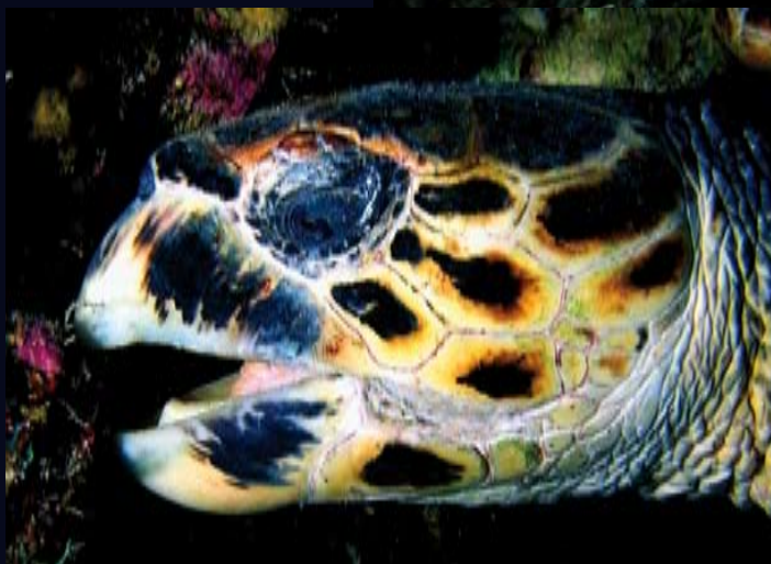
Želvy mají málo vyvinutý jazyk