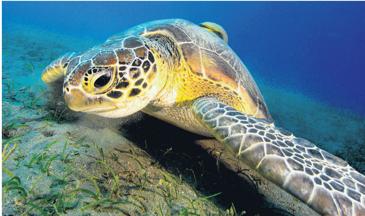
KARETA OBROVSKÁ. Želvu vyfotila Martina Balzarová pod vodou v lokalitě Marsa Dabbab v Egyptě. Zvíře bylo podle ní veliké zhruba 130 centimetrů. Snímek je součástí výstavy Podmořská setkávání v českobudějovické radniční síni.

První zkušenosti sbírala v bazénu. Poté kurz dokončila na Kypru, kde se také poprvé potápěla na otevřeném moři. „Vybavuji si jenom to, že se mi to moc líbilo. Připadalo mi to velice přirozené,“ dodává. Během let se postupně potápěla na mnoha místech. Poznala podmořský svět na Sardinii, v Chorvatsku, Egyptě, Vietnamu, Mexiku i Indonésii.